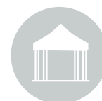
CAMPAMENTO HUMANITARIO EN EL NORTE DE SALTA

Llevamos adelante una labor permanente junto a más de 5.000 personas wichis y tobas a través de nuestro Campamento Humanitario en el norte de Salta. El objetivo de la misión humanitaria es contribuir a mejorar su acceso a derechos y a evitar la pérdida de vidas, problemática por la cual se declaró la emergencia sociosanitaria en la zona a principios de año. Hoy más del 80% de las comunidades afectadas cuenta con acceso a agua segura, tiene mejor y más acceso a la salud, está capacitada en higiene, salud, Primeros Auxilios, entre otros temas clave. De cara al 2021, estamos implementando mejoras de saneamiento, condiciones y adecuaciones para una buena higiene y apoyando el desarrollo de sus medios de vida.